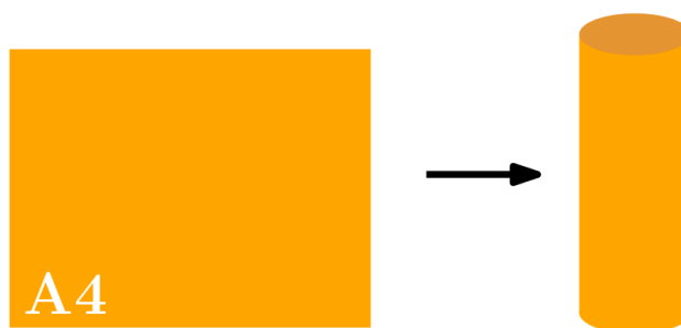
Рис. 2. Изготовление маяка

D.2.1. Маяки имеют высоту 210 мм и диаметр 40 мм, и изготавливаются из оранжевой бумаги формата А4. Лист бумаги сворачивается в цилиндр диаметром 40 мм (см. рис. 2), после чего утяжеляется снизу.