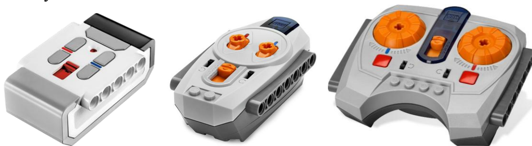
Рисунок 2 «Примеры распространенных ИК-пультов»