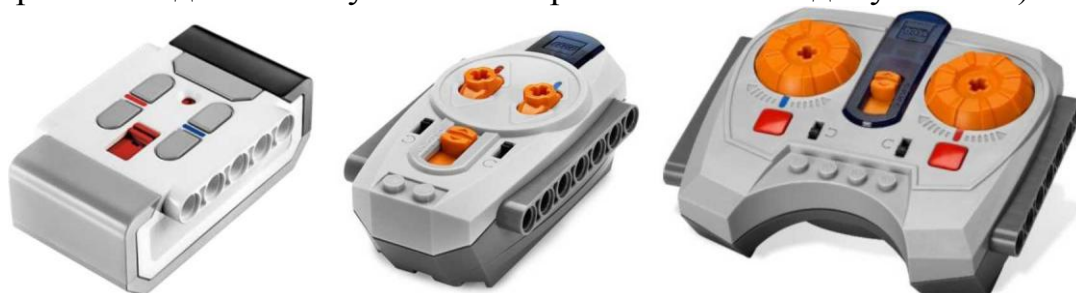
Рисунок 2 «Общий вид конфигурации полигона»