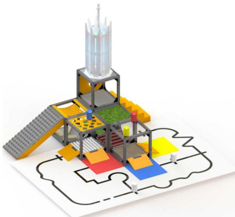
Рисунок 1 «Общий вид конфигурации полигона»