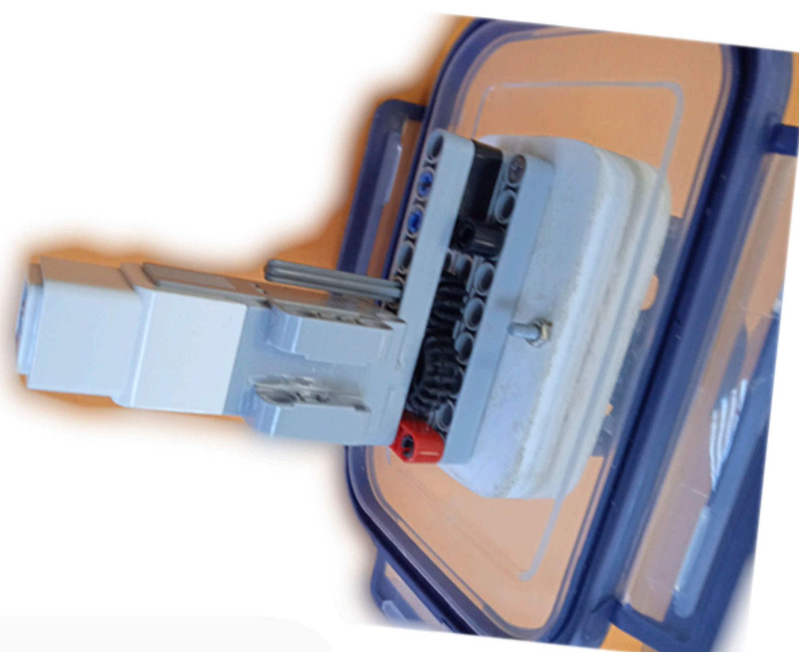
Узел погружения и всплытия