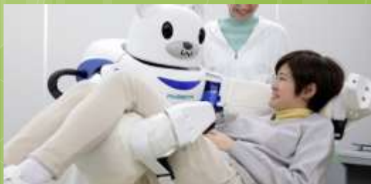
Аналог Медсестра Robear